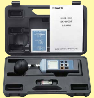
SK-150GT専用ハードケース

●黒球温度計・温度計・湿度計が一体となった、ハンディタイプのWBGT指数測定器です。 熱中症予防の目安や、労働環境の熱ストレスの評価として使用されるWBGT指数をはかることができます。