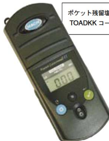
ポケット残留塩素計 TOADKK コード : HACH2470