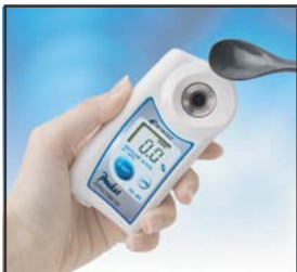
① プリズム面にサンプルを滴下します。