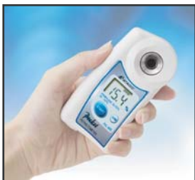
③ 約3秒後に濃度%を表示します。