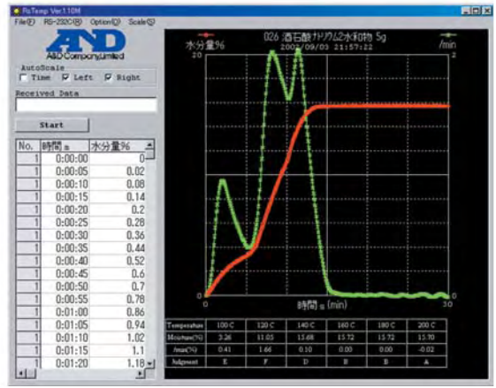
酒石酸ナトリウム二水和物