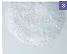
3 酒石酸ナトリウム