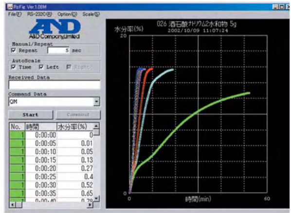
酒石酸ナトリウム二水和物

RsTemp, RsFig 対応OS Windows, Windows 95, Windows 98, Windows 2000, Windows XP, Windows Vista, Windows 7